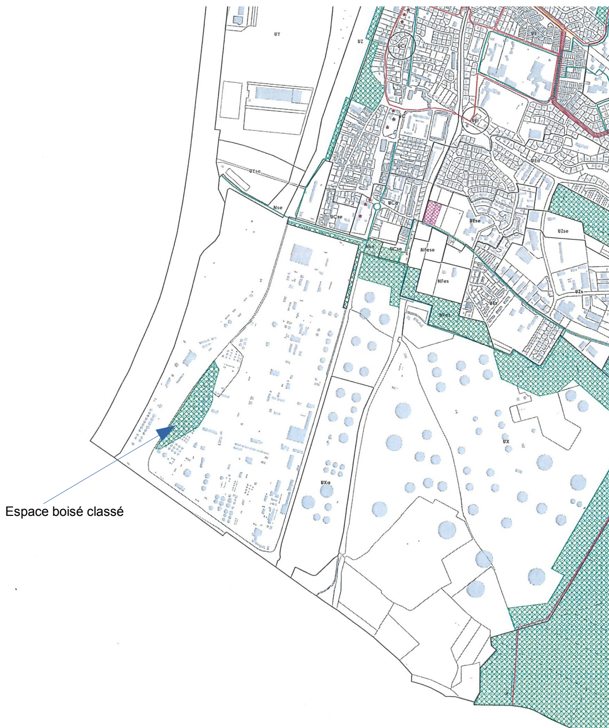
Extrait du plan de zonage du PLU 2017 de Petit Couronne